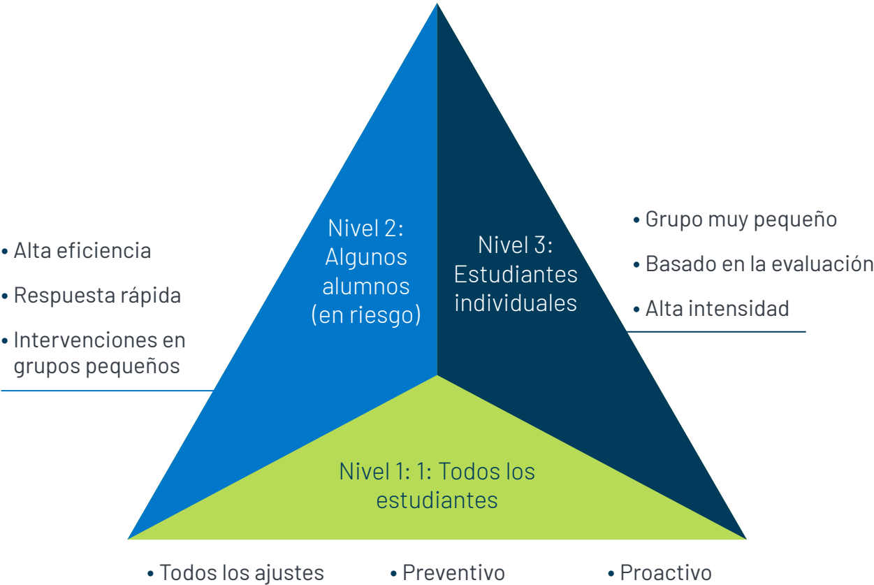
Modelo de tres niveles de apoyo escolar. Illinois Statewide Technical Assistance Center (ISTAC).

Las intervenciones de Nivel 3 tienen un nivel de intensidad aun mayor que las del Nivel 2 y también se proporcionan además de la instrucción principal. Las intervenciones de Nivel 3 son típicamente proveídos a un estudiante individuo o quizás a dos o tres estudiantes a la vez. Las intervenciones son adaptadas específicamente a las necesidades de cada estudiante. Los estudiantes pueden pasar con fluidez de un nivel a otro como resultado de su respuesta a las intervenciones